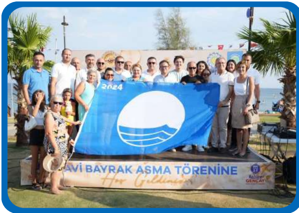
MAVİ BAYRAK DİDİM İLÇE TÖRENİ