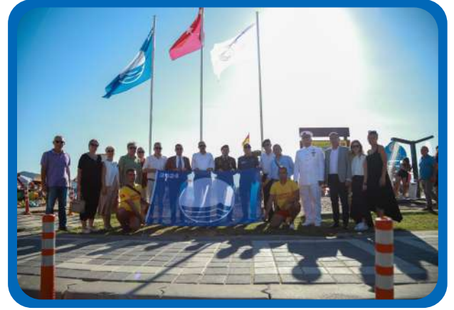
MAVİ BAYRAK BURHANIYE İLÇE TÖRENİ