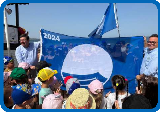
MAVİ BAYRAK ÇANAKKALE İL TÖRENİ