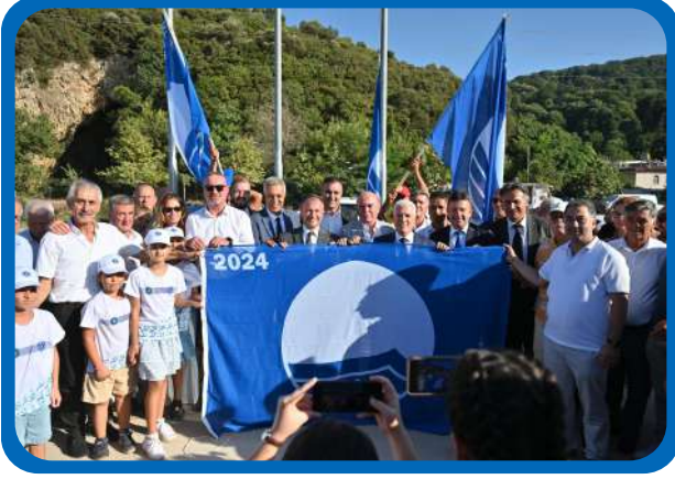
MAVİ BAYRAK BURSA İL TÖRENİ