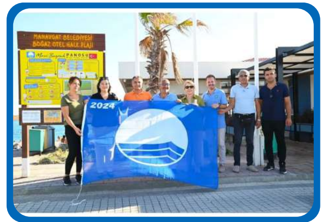
MAVİ BAYRAK MANAVGAT ÖDÜL TESLİM TÖRENİ