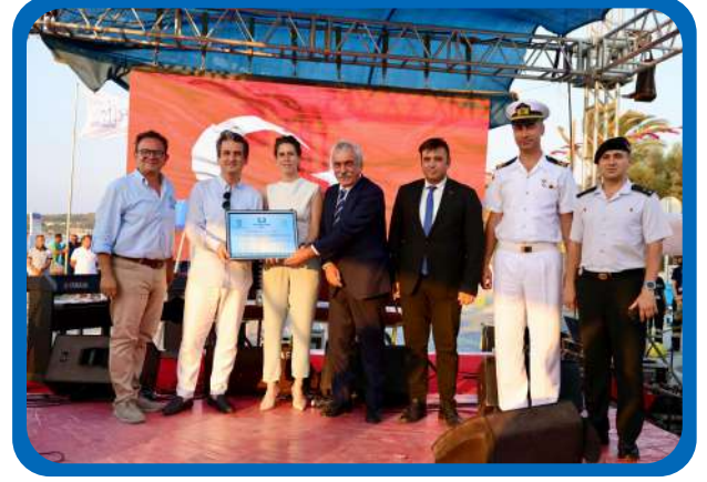
MAVİ BAYRAK İZMİR İL TÖRENİ