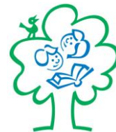
LEARNING ABOUT FORESTS