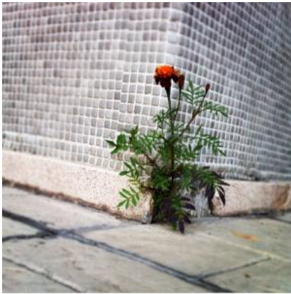
Ankara Büyük Kolej "Survival" (Havatta Kalıs)