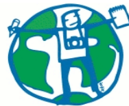
Young Reporters for the environment