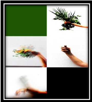
"Destruction is inevitable-Ones who cease the natural order will be the victims of their greedy appetite."