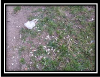
"Don't harm yourself and the environment!"