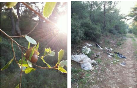
2. Doğan Demire'in temiz ve kirli kareleri.

Mansiyon kazananlara mp4 çalar ve kitap ile KUFSAAD tarafından 1 aylık fotoğraf eğitimi ödül olarak verilmiştir.