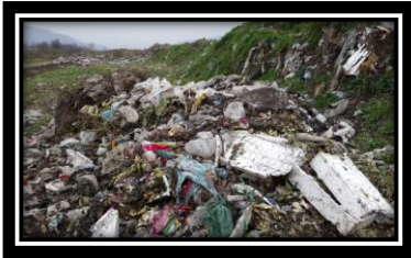
"Could you notice me?"