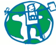
Çevrenin Genç Sözcüleri