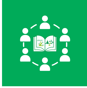
Toplumda Çevre Okuryazarlığı