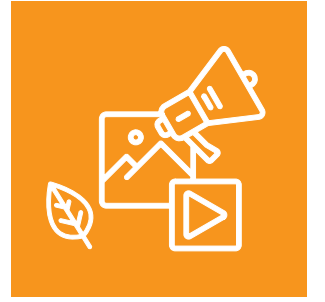
Medya ve Çevre Eğitimi