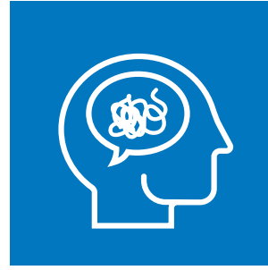
Eko-anksiyetenin Eğitim Çalışmalarına Etkisi