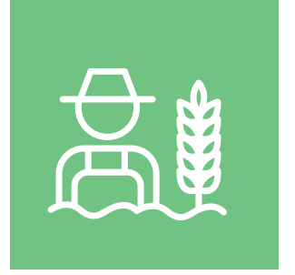
Çevre Eğitiminin Yaygınlaştırılması