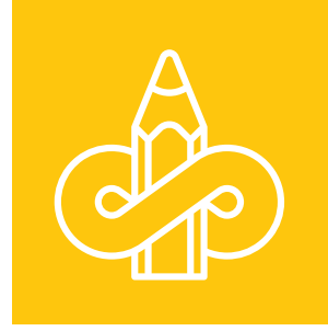
Yetişkinler için Çevre Eğitimi- Yaşam Boyu Öğrenme