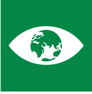
İklim Değişikliği ve Uyum Eğitimi