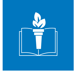
Yükseköğretimde Çevre ve Sürdürülebilirlik Eğitimi