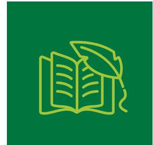
Edebiyatın Çevre Eğitimindeki Rolü