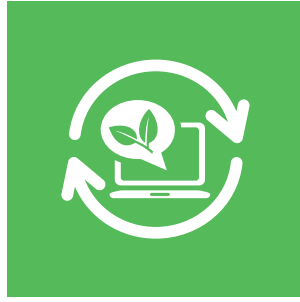
Sürdürülebilir Gelecek için Yeni Teknolojiler