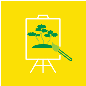
Sanat ve Kültürün Çevre Eğitimindeki Rolü