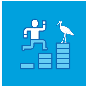
Başarının Ölçülmesi: Çevre Eğitimi Programlarının Etkinliğinin Değerlendirilmesi