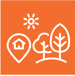
Yerel Yönetimler ve Çevre Eğitimi