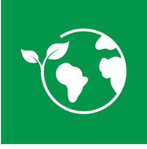
Çevre Eğitiminde Uluslararası Yaklaşımlar