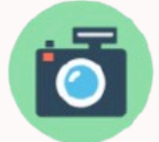
Turistik Cazibe Merkezi