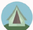
Kamp Alanı & Tatil Parkı